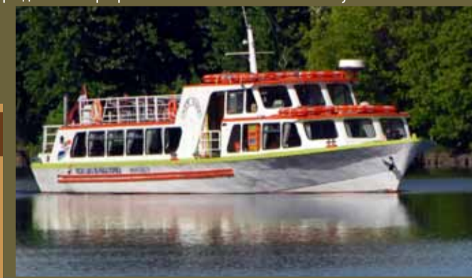
График движения кораблика Рига-Майори-Рига:

Речной кораблик „New Way“ можно также арендовать для отдельных групп и праздничных мероприятий по тел.: +371 29237123. www.jurmala.lv